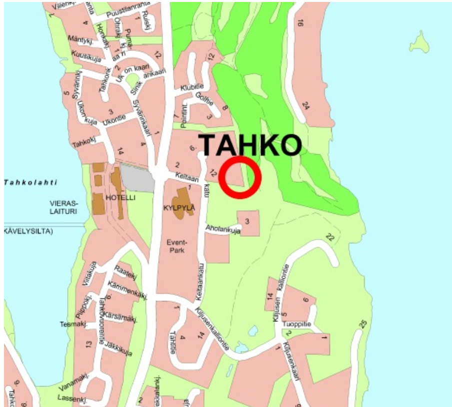
Alueen sijainti esitettyä opaskartassa.