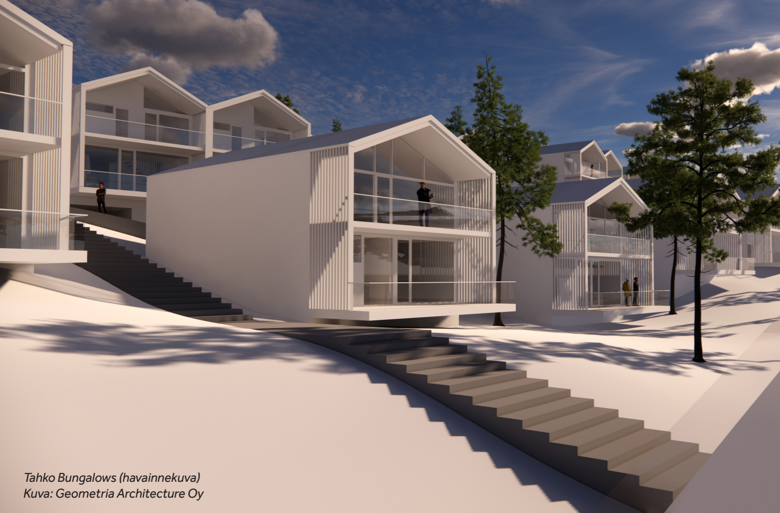
Tahko Bungalows (havainnekuva) Kuva: Geometria Architecture Oy