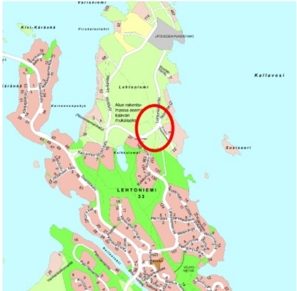
Tonttien sijainti esitettynä opaskartassa.