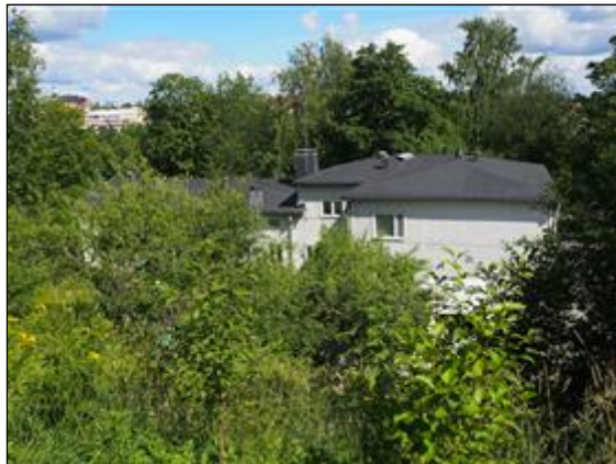
Rakennus Myhkyrinkadulta lännestä